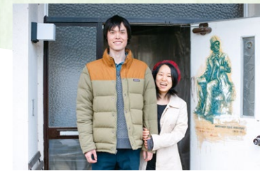
庭や池のある中古住宅を購入し、妻と2人で少しずつ改修している。隣の畑も購入予定。