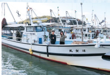
小型底引き船「達聖丸」と一緒に。冬場はカニやヒラメ、カレイ、舌平目、イカなどが獲れる。