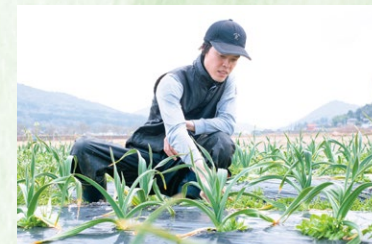
落花生は、出荷すればすぐに完売する人気ぶり。収穫後に植えたジャンボニンニクも順調に育っている。