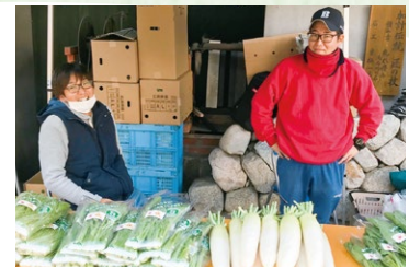
農家と県担当者、JA指導員たちが月に一度集まり情報交換する「経営者部会」が昨年発足した。