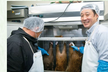
駆除により仕留めた鹿やイノシシが冷蔵されている。まだ手作業の工程が多く、設備の充実も課題の一つ。