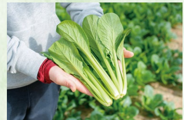
出荷を待つ小松菜。害虫や病気、成長の疑問などは、写真に撮って連絡を取り合い、失敗も糧に次に生かしているという。