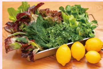
有機野菜を栽培する農家の畑から、自ら収穫した新鮮野菜と、佐木島産レモン。

千葉県出身。東京の飲食店で働いた後、28歳の時にフランスへ。10年後に帰国し、東京から三原市へ移住。2018年5月にフレンチレストラン「aura」をオープン。