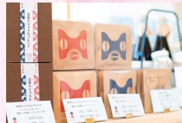
金魚ちょうちんをモチーフにしたパッケージイラストは、柳井ブランドに認定されている。