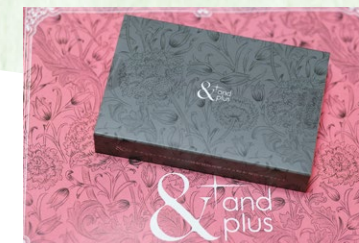
自社で開発、商品化したサブリ「アンドプラス」。さわやかなレモン風味が特徴。