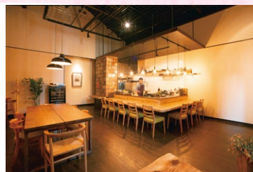
元ギャラリーだった店舗との出会いが、三原市へ移住したきっかけの一つ。