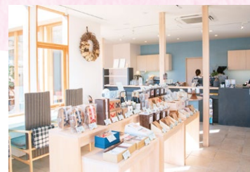
店舗は焙煎豆を販売するほか、ゆったりとしたカフェスペースも備えている。