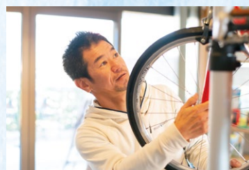
「今後はレンタサイクルの台数を増やし、シェアハウス事業もしたい」と夢が広がる。