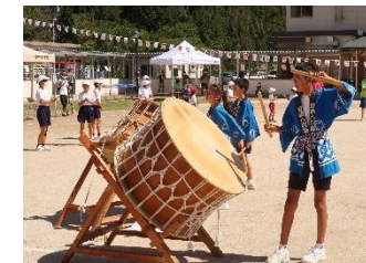
地域に伝わる八朔踊り