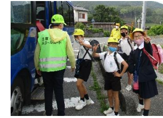
安全ボランティア