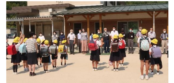
学校応援団との対面式

学校応援団活動のプロジェクト化 学び・教育課程における学習支援 環境・・・環境整備・安心安全 ふれあい・・・地域行事の伝承