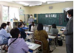
保護者学級懇談会