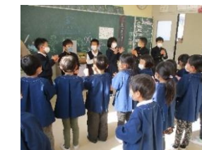
ひづみ保育園との交流