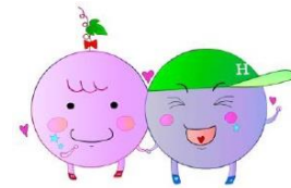
日積小キャラクター ひづみん