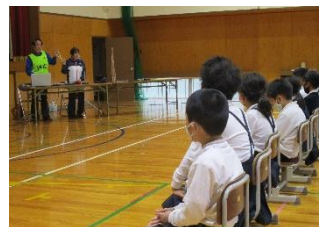
人権教育参観・講演会