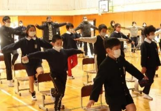
学校保健安全委員会