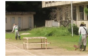
環境ボランティア