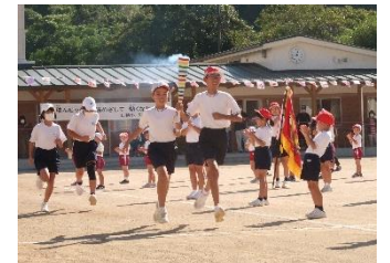
日積ふれあい運動会