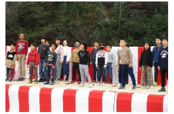
日積ふるさとまつり