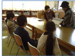
読み語りボランティア