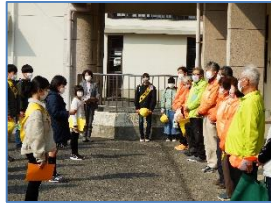
スクールガード協議会