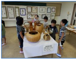
地域ギャラリー・昔の写真展 (コミュニティ・ルームの活用)