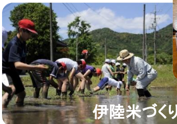
伊陸米づくり(高学年)