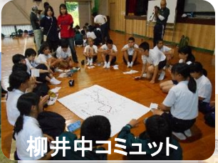
柳井中コミュニティ