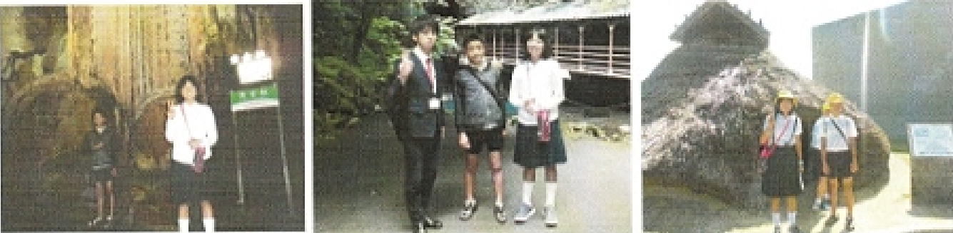
6年生の修学旅行のようす