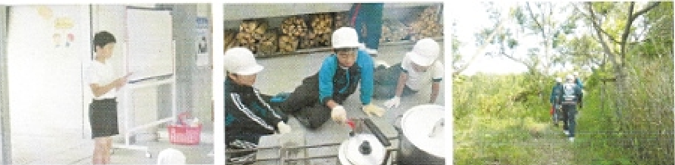
5年生の宿泊体験学習のようす

5月17日(木)~18日(金)まで5年生の宿泊体験学習が、由宇青少年自然の家で行われました。また、5月31日(木)~6月1日(金)まで6年生は修学旅行で萩、秋吉台、下関方面へ行きました。どちらも柳井市内の大畠小・伊陸小・日積小と合同で行われる交流行事でもあります。ふだん少人数で生活している子どもたちにとって、集団での生活は慣れないことも多々あったようでしたが、5年生も6年生も積極的に他校の仲間と関わり、協力して活動を楽しむことができました。どちらも思い出深い有意義な体験となりました。