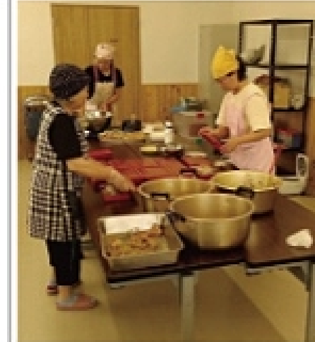
朝早くからボランティア婦人部の方達がお弁当を作られました。

六月二日(土)ボランティア婦人部による「平郡東ふれあい給食」が行われました。炊き込みご飯に五品の総菜と全て手作りで、六十五歳以上の一人暮らしの方三十三世帯に福祉協議会の方々が無事に配達してくれました。毎回楽しみにしている方が多く今回も「ありがたい美味しかったよ」という声に配達をされた方々も嬉しかったそうです。婦人部と社会福祉協議会の方々、本当にお疲れ様でした。