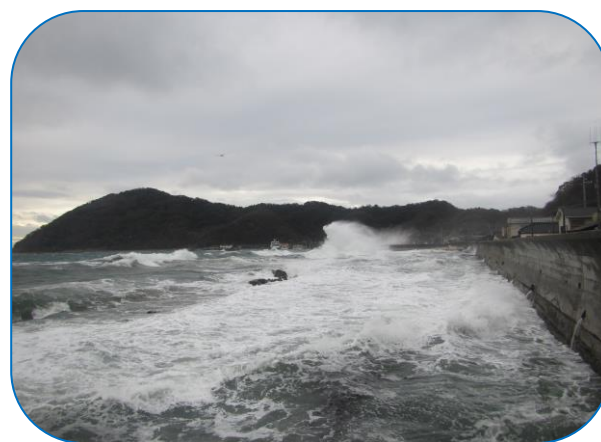
波浪の様子 (1月27日撮影)