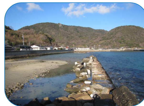
波浪により決壊した一文字の堤防