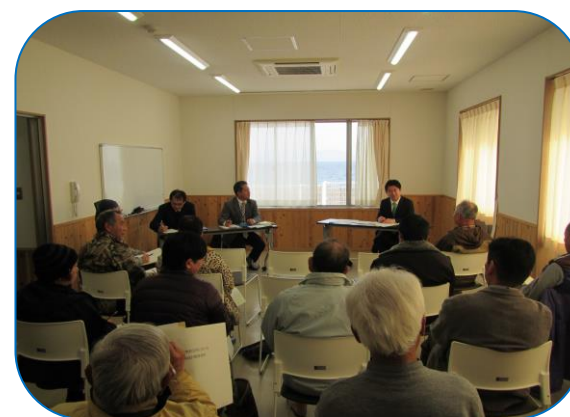
トーク会場の様子

市長はトークの後に、埋立地の壊れてしまった金網フェンスや、ゴミが詰まった排水口等を視察されました。