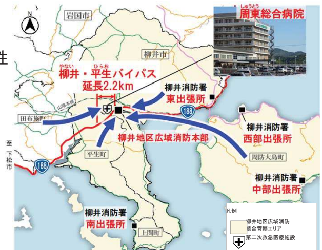
図 柳井・平生地域の救急搬送状況

※H27全国道路・街路交通情勢調査の混雑時旅行速度より整備後は、柳井・平生バイパス設計速度60km/hで算出