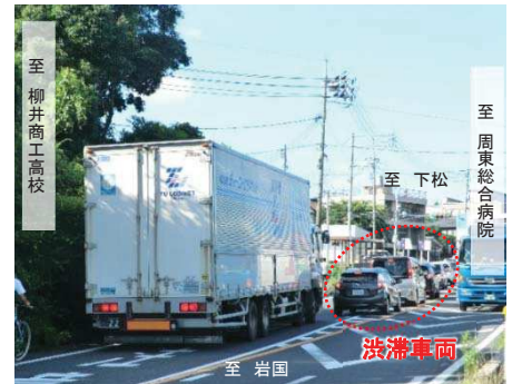
写真① 交通混雑の状況