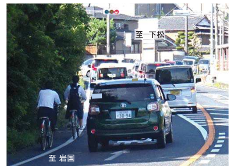
写真② 狭小区間における自転車走行状況