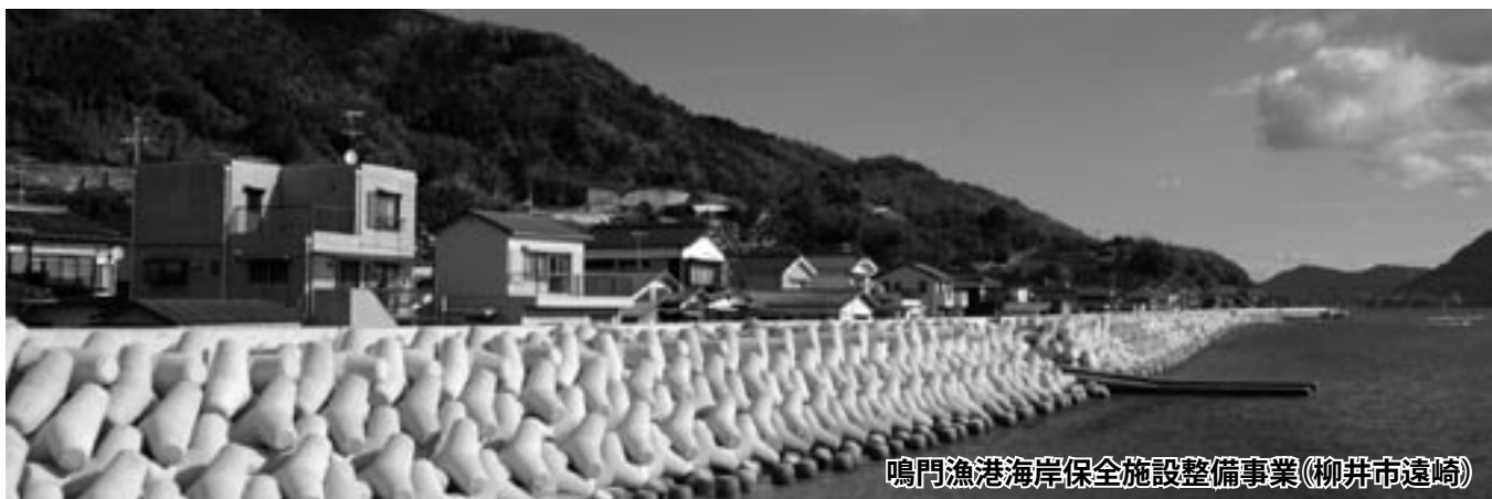
鳴門漁港海岸保全施設整備事業(柳井市遠崎)