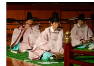
地域の方の参観(雅楽)