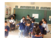
年長・児童の交流