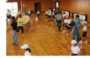
地域に伝わる八朔踊りの学習