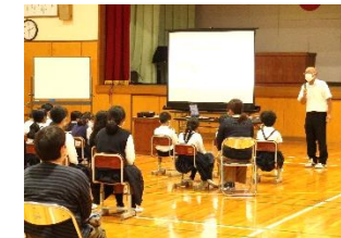
人権教育参観・講演会