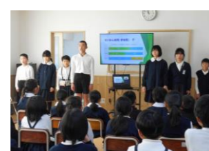
学校保健安全委員会