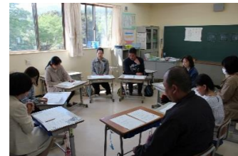
保護者学級懇談会