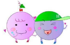
日積小キャラクター ひづみん