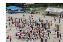
日積ふれあい運動会