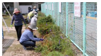
環境ボランティア