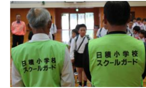
安全ボランティア