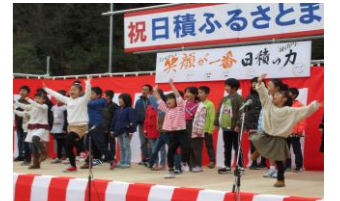
日積ふるさとまつりで発表