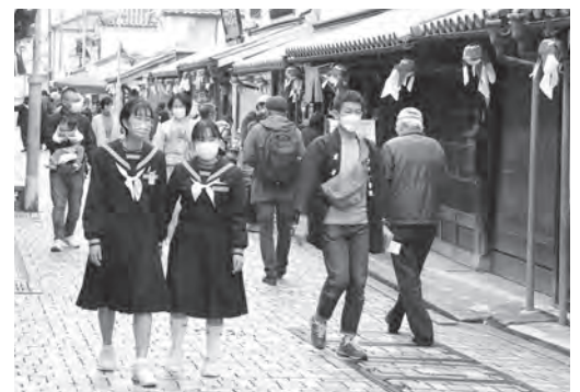
▲賑わう白壁の町並み

花と香りをテーマにした白壁の町並みの春のイベント「花香遊」が開催され、約2,000人の人出で賑わいました。新型コロナウイルス感染症の影響で3年ぶりの開催となったこの日は、投扇興や歴史講演、本市出身の音楽家によるコンサート、柳井中生徒の美術作品展示など多彩な催しが行われ、訪れた人は久々の祭りを楽しんでいました。