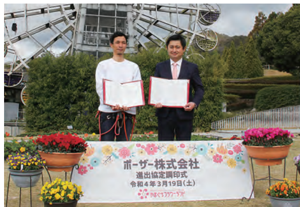
▲協定を締結した三由社長(写真左)と井原市長

◀ハイラインとは、高所に張ったラインを渡るスポーツのこと。調印式に合わせて高さ約15mのラインを張り、三由社長によるパフォーマンスが行われました。