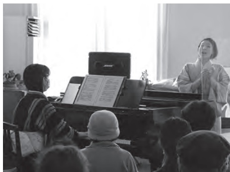
▲ソプラノの歌声が響くコンサート