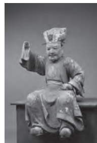
▲大権修利菩薩倚像

大権修利菩薩倚像は須弥壇の下、向かって左奥に置かれています。帝王の冠帽を被り、文様が鮮やかな衣服をまとう腰をかけ、右手を額にかざして遠方を見詰めています。南海からの船を安全に航行させる役割を担い、禅宗を守護しています。