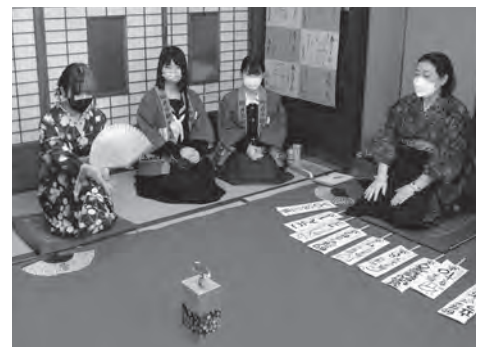
▲投扇興を楽しむ参加者