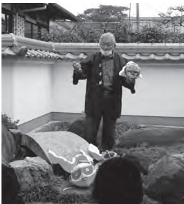
▲歴史講演 「大人気の柳井金魚ちょうちん」