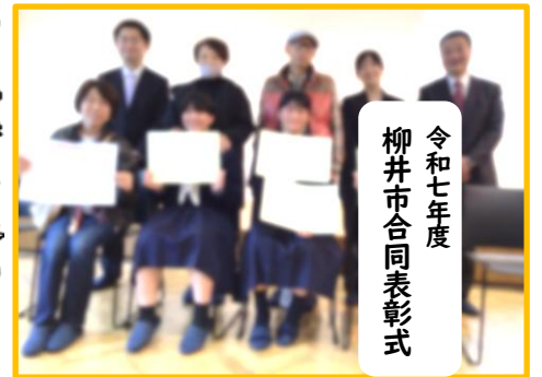
令和七年度 柳井市合同表彰式