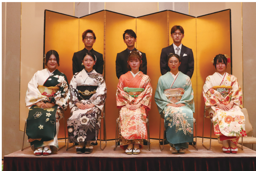
▲二十歳の集いスタッフを務めた皆さん(順不同)

令和8年柳井市二十歳の集いでスタッフを務めた皆さんです。企画、運営のために、昨年9月から準備を重ね、当日は受付や式典・懇親会の司会進行、挨拶など、裏方として式を支えました。