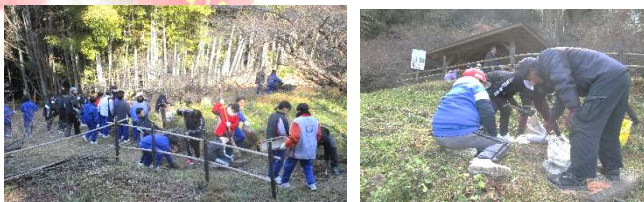
寒い中お疲れさまでした!

1月22日(木)梅見の時期を前に、国指定天然記念物『余田臥龍梅』周辺の清掃作業を行いました。寒い中、余田小3・4年生、柳井西中1年生、地域の皆さんに参加していただき、たいへんきれいになりました。作業にご協力いただいた皆さん、ありがとうございました。