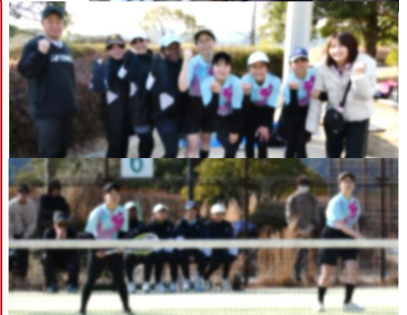
男子はコンソレ(初戦敗者同士での戦い)で優勝、女子も健闘しました。