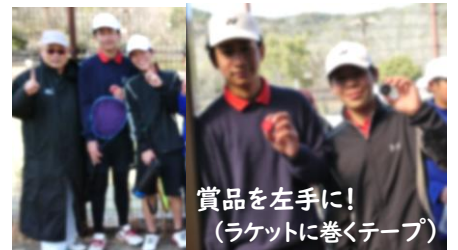
賞品を左手に! (ラケットに巻くテープ)