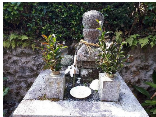
吉村備後ノ守勝直の五輪塔