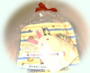
3か月の訪問での プレゼント（一例）