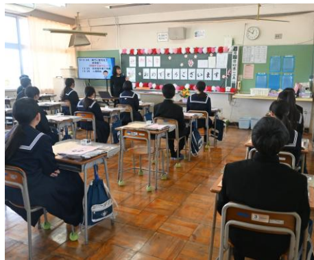
新入生 入学式前のオリエンテーション