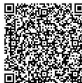
光市立大和総合病院(半日)