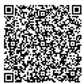
周東総合病院(半日)