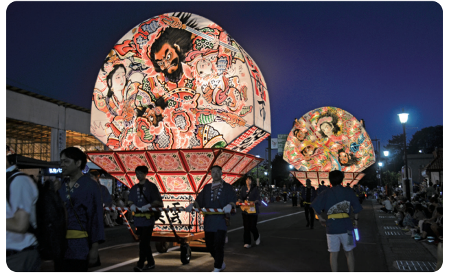
弘前ねぶたまつり 2025