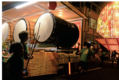
ねぶたの後ろについて歩く太鼓部隊

三上氏 そう、最大の見どころは、大型ねぶたが信号機をどうかわすのかと思いきや、ねぶた自体が正面の鏡絵を常に観客に見せながら5メートルに縮まる(昇降する)のです。この光景をぜひ目に焼き付けてほしいですね。