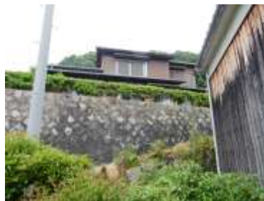
外観(下の道路から)