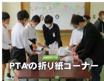
PTAの折り紙コーナー

フェスタを盛り上げてくださったのが、保護者や地域の方です。保護者の方は、折り紙コーナーを設け、子どもたちを楽しませてくださいました。地域の方は、読み聞かせのコーナーを設け、子どもたちや小さな子ども連れのお母さんがお話に聞き入り、会場が温かな雰囲気になりました。また、余田保育園さんや余田婦人会さんの展示物が会場を華やかに彩ってくださいました。ご協力ありがとうございました。