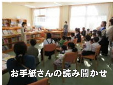
お手紙さんの読み聞かせ