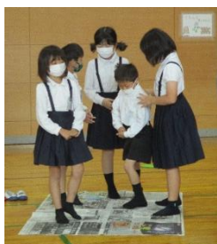
新聞のりじゃんけん