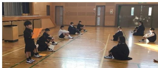
新年の誓いを発表する子どもたち

校長からは、「3学期は短いけれどもとても大切な学期。新しい目標に向けて新たな挑戦をしよう」という話をしました。3学期の授業日は、6年生44日、1～5年生48日という本当に短い学期です。同時に次年度へつながるとても重要な学期でもあります。一日一日を大切に、学年のまとめに向けて学校で取り組んでまいります。ご家庭・地域でも南っ子の成長の後押しをする温かい言葉や見守りをいただけると幸いです。本年も、どうぞよろしくお願いいたします。