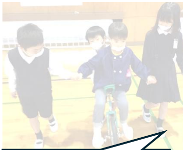
1・2 年生。園児さん が一輪車に挑戦する お手伝いをしました。