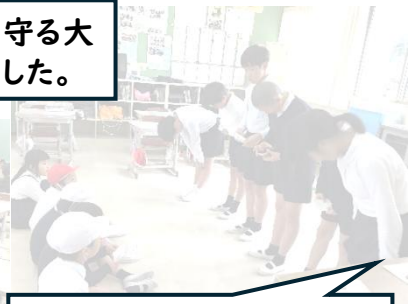
5・6 年生。全校児童があ いさつリーダーになれる ように取り組んでいます。