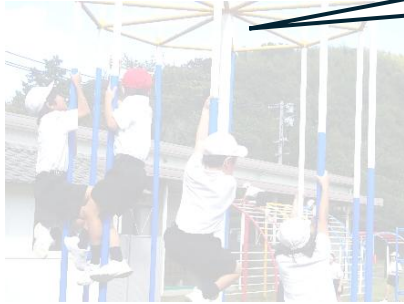
健康委員会による 体力チャレンジ「サスケ」