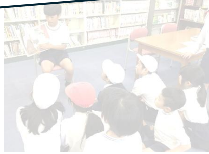
メディア委員会による 絵本の読み聞かせ