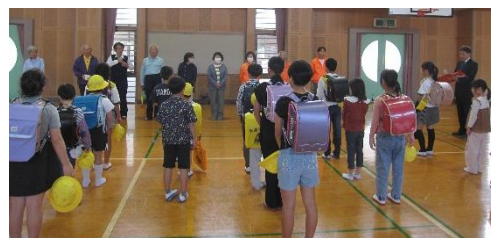
学校応援団の方々との対面式