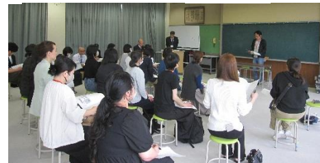
令和8年度育友会総会

授業参観のあと、学校応援団の方々との対面式がありました。学校応援団の方々には、登下校の見守り、学習支援や環境整備など様々なかたちでご支援をいただいています。今年度も地域の方々との連携をはかり、心のふれあいを大切にしたい教育活動を推進していきます。