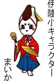
伊陸小キャラクター まいか